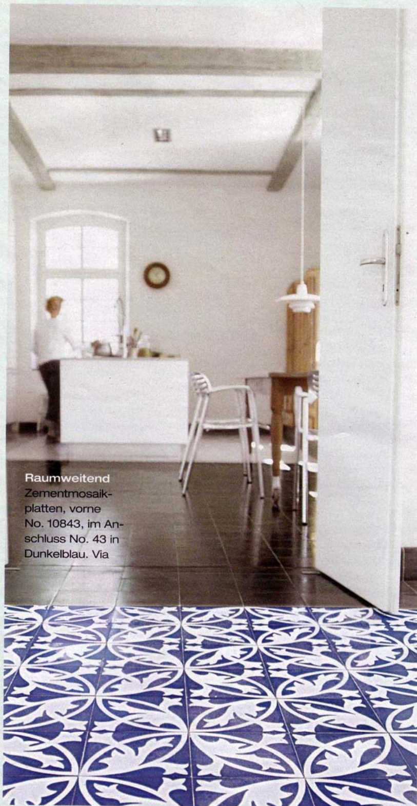
Raumweitend Zementmosaik- platten, vorne No. 10843, im An- schluss No. 43 in Dunkelblau. Via

T raditionell in mediterranen Ländern eingesetzt, sind marmorgebundene Zementfliesen auch bei uns stark im Kommen. Verglichen mit Keramikfliesen fühlen sie sich weicher und glatter an. Die Farben wirken samtig und warm, besonders die Pastelltöne. Zementfliesen eignen sich für Böden und Wände, was zusammen mit der großen Mustervielfalt einen enormen Gestaltungsspielraum ermöglicht: „Mosáico“ bietet 300 Muster und 36 Farben an, die individuell kombiniert werden können.