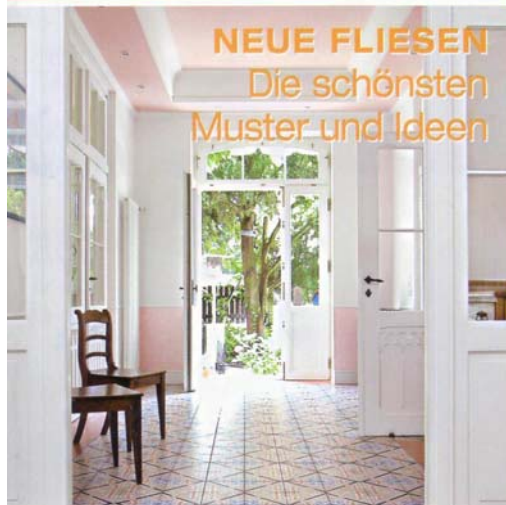
NEUE FLIESEN Die schönsten Muster und Ideen