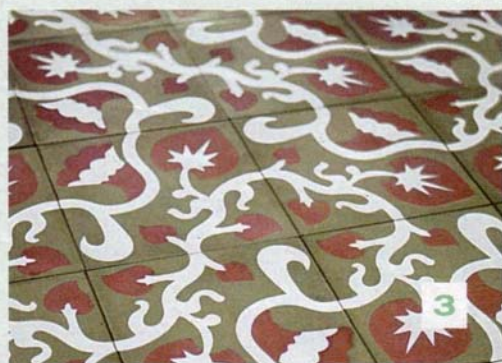
1 Schimmernd Die seidig glatten Oberflächen sind äußerst robust: Zementfliesen No. 31 von Via

F liesen werden seit Jahrtausenden als Baustoff verwendet. Ihr größter Vorteil ist ihre Langlebigkeit, was sie auf Dauer gegenüber anderen Bodenbelägen auch preisgünstig macht. Es gibt verlockend schöne Dekore, dennoch sollte nicht allein die Optik für den Kauf entscheidend sein. Keramik, Naturstein oder Zement haben spezielle Qualitäten und Anwendungsbereiche. Fliesen werden zudem in Klassen eingeteilt, die Auskunft geben über Strapazierfähigkeit und Trittfestigkeit.