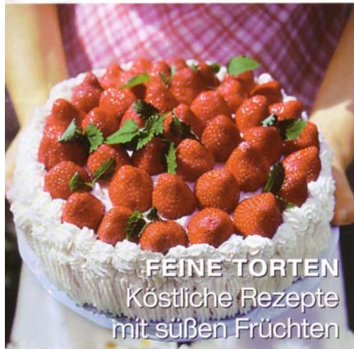
FEINE TORTEN Köstliche Rezepte mit süßen Früchten

INSPIRATIONEN - WOHNEN UND DEKORIEREN, GÄRTNERN UND GENIEßEN