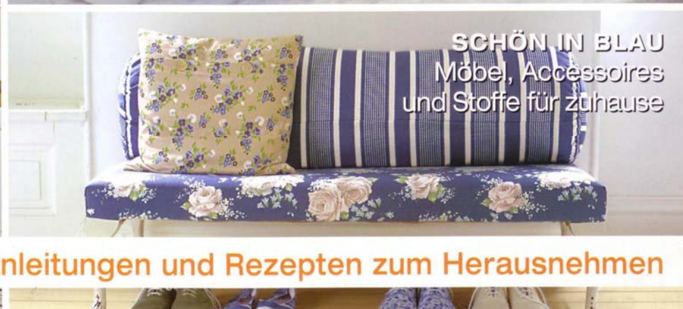
SCHÖN IN BLAU Möbel, Accessoires und Stoffe für zuhause

Mit 33 ausführlichen Anleitungen und Rezepten zum Herausnehmen